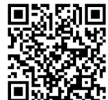
Mats Thiele Hauptjugendwart